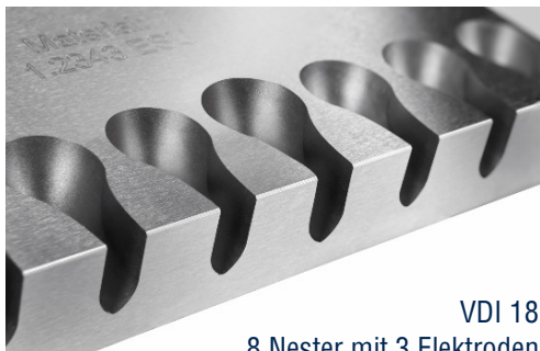
VDI 18 8 Nester mit 3 Elektroden

Wir präsentieren Ihnen unser innovatives Maschinenkonzept und den neuen EAGLE PowerSPARK Generator für höchste Präzision und einzigartig feine Oberflächen bei geringstem Verschleiß .